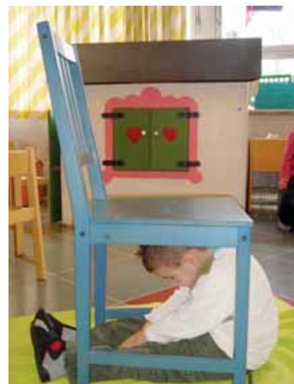
Diese Aktivitäten waren eine Idee der Précocé-Klasse von Monique Folscheid-Konen und Mady Batani aus Pontpierre.